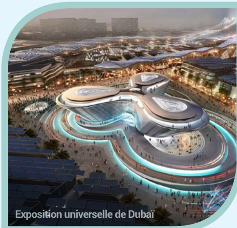
Exposition universelle de Dubaï