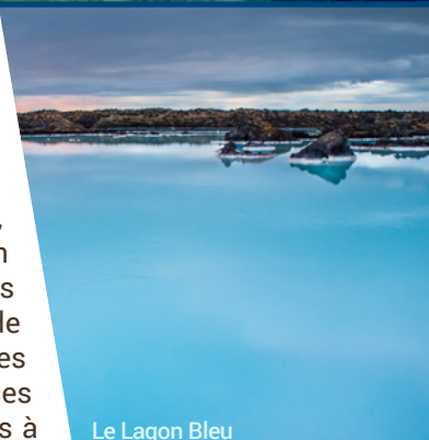
Le Lagon Bleu