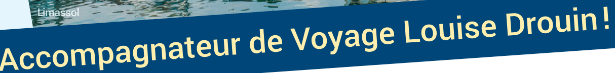
Château de Kolossi