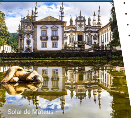
Solar de Mateus