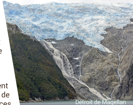
Détroit de Magellan

Situé sur l'île de Hornos, au Chili, dans l'archipel de Tierra del Fuego, le cap Horn est largement considéré comme le point le plus austral de l'Amérique du Sud. Le point culminant de la chaîne de montagnes des Andes, le cap légendaire est sujet aux caprices de Dame Nature! Néanmoins, ces conditions ont protégé la région rocheuse de l'humain, de sorte que vous serez en mesure d'apprécier la nature telle que les premiers explorateurs l'ont découverte, il y a des siècles. Formations rocheuses inhabituelles sillées de rainures profondes et des falaises en granit couvertes d'arbres vous y attendent... La navigation autour du Cap était un exploit inespéré pour les marins qui ont bravé ses vents violents et ses eaux au XVII e siècle. Du temps de la navigation à voiles, le cap Horn était un point de passage obligé des routes commerciales entre l'Europe et l'Asie. Franchir le cap Horn a toujours été redouté des marins : on l'appelait le « cap dur », ou le « cap des tempêtes ». Bien que le cap Horn soit devenu une importante route commerciale entre le XVIII e et le début du XX e siècle, l'ouverture du canal de Panama a rendu cette voie obsolète.