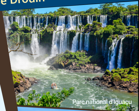
Parc national d'Iguaçu

Profitez de ce voyage pour découvrir le Chili et l'Argentine, deux fabuleux pays de contrastes. Notre voyage débutera avec la découverte de la capitale, Santiago, et se poursuivra dans la vallée de Casablanca, territoire vinicole très réputé. Nous terminerons ce beau périple avant notre croisière à Valparaíso. Cette ville à flanc de montagne est spectaculaire avec ses 42 collines qui l'entourent et qui se jettent dans la mer. Il est maintenant temps de faire l'embarquement sur l'« Infinity » de la compagnie Celebrity Cruises pour les 12 prochaines nuits. Un rêve pour tous que de naviguer à travers fjords, estuaires, le canal de Beagle et le détroit de Magellan. La nature à l'état sauvage! Et nous voilà en Terre de Feu, au bout du monde comme on dit là-bas à Ushuaia. À la fin de cette superbe croisière, nous aurons le bonheur de visiter l'une des merveilles de ce monde, les chutes d'Iguaçu, avant de revenir vers la fabuleuse capitale argentine, Buenos Aires, pour y découvrir son charme, ses couleurs, sans oublier la passion de son peuple avec l'incroyable danse, le tango! Une belle façon de se sauver des températures froides de l'hiver québécois et de vivre le passage de la saison d'hiver à celle du printemps durant cette navigation du Chili à l'Argentine avec ses paysages grandioses!