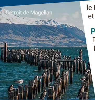
Détroit de Magellan

Ferdinand Magellan. À bord de votre navire, parcourez des centaines de kilomètres de Punta Arenas vers le Pacifique. Profitez de cette belle navigation en découvrant de minuscules îles, des spectaculaires vallées et les incroyables sommets enneigés de la Cordillère des Andes.