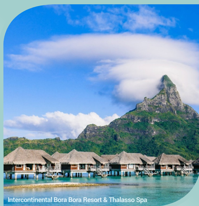
Intercontinental Bora Bora Resort & Thalasso Spa