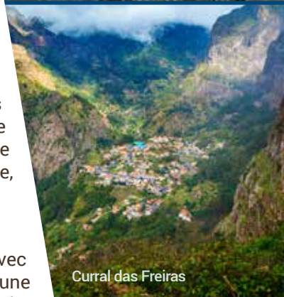
Curral das Freiras

Matinée libre et dîner à l'hôtel. En après-midi, départ pour un paysage beaucoup plus montagneux avec une végétation d'eucalyptus et de châtaigniers. Arrêt à Eira do Serrado (à 1094 m d'altitude) pour une vue panoramique sur la vallée, au fond de laquelle est blotti le village de Curral das Freiras (le village des nonnes). On y aperçoit alors le plus grand cirque montagneux de Madère. Poursuite vers le belvédère de Garajau, célèbre pour sa statue du « Cristo Rei » tournée vers la mer et les bras ouverts. Continuation vers le port de pêche le plus important de Madère : Câmara de Lobos. Le décor fait de bateaux et de filets de poissons qui séchent à l'air libre plongent le visiteur dans la vie quotidienne du pêcheur. Souper dans un restaurant local à Funchal. (PD/D/S)