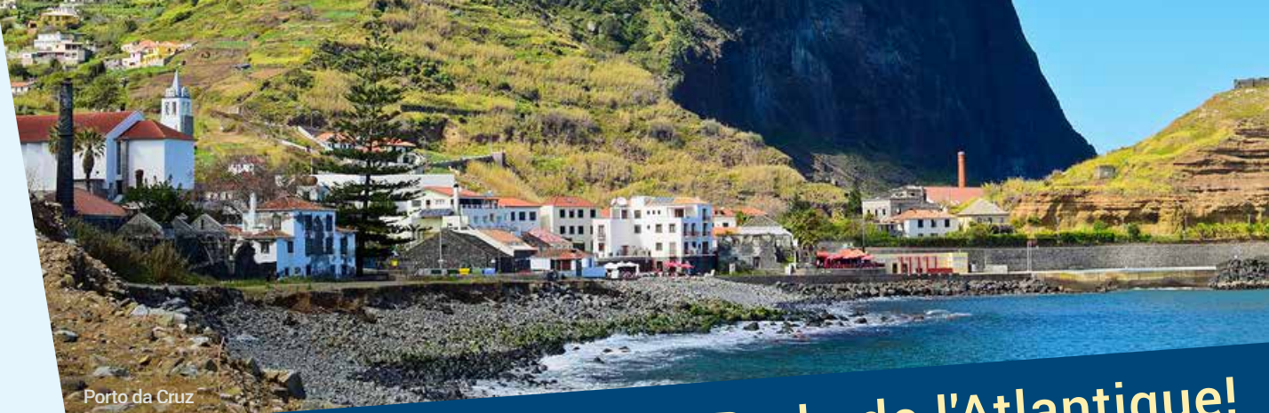
Porto da Cruz