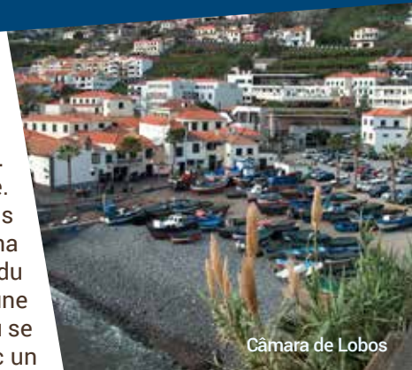
Câmara de Lobos