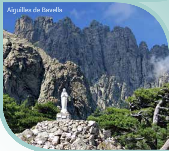
Aiguilles de Bavella

Rassemblement pour un dîner typique à la Bonifacienne et si la météo le permet, départ pour une excursion en bateau aux grottes et falaises de Bonifacio. Reste de l'après-midi libre. Souper en soirée à votre hôtel de Bonifacio. (PD/D/S)