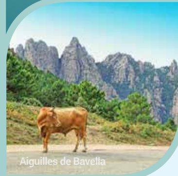
Aiguilles de Bavella