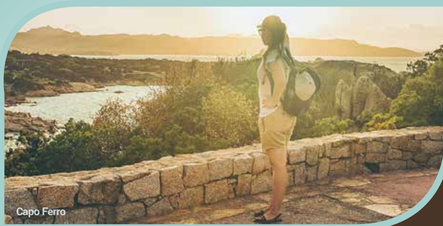
Archipel de la Maddalena