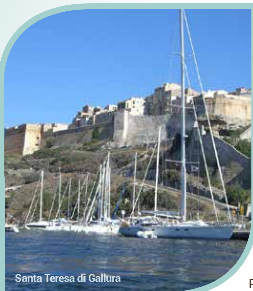
Santa Teresa di Gallura