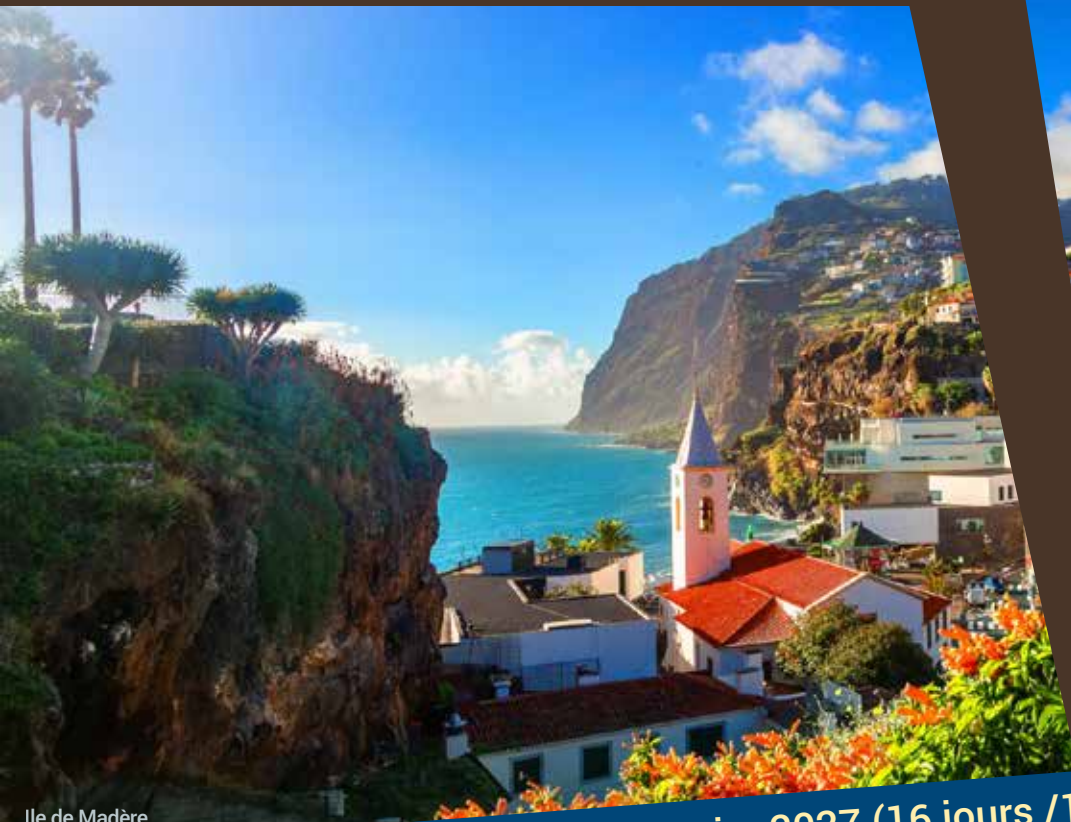
Ile de Madère

À BORD DU NAVIRE INFINITY DE CELEBRITY CRUISES