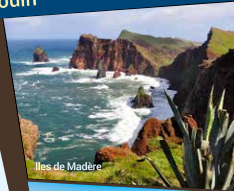
Iles de Madère