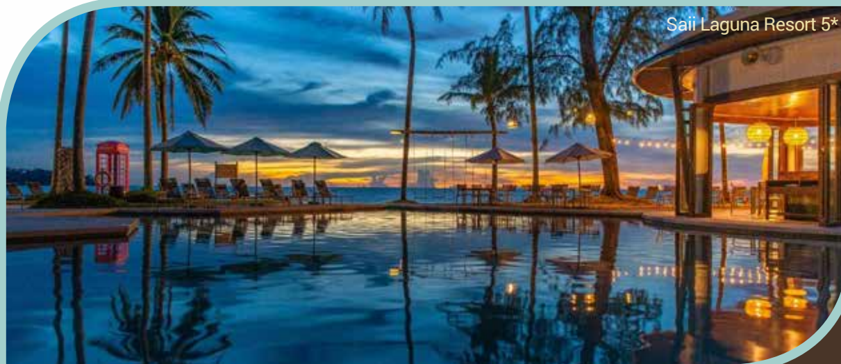
Saii Laguna Resort 5*