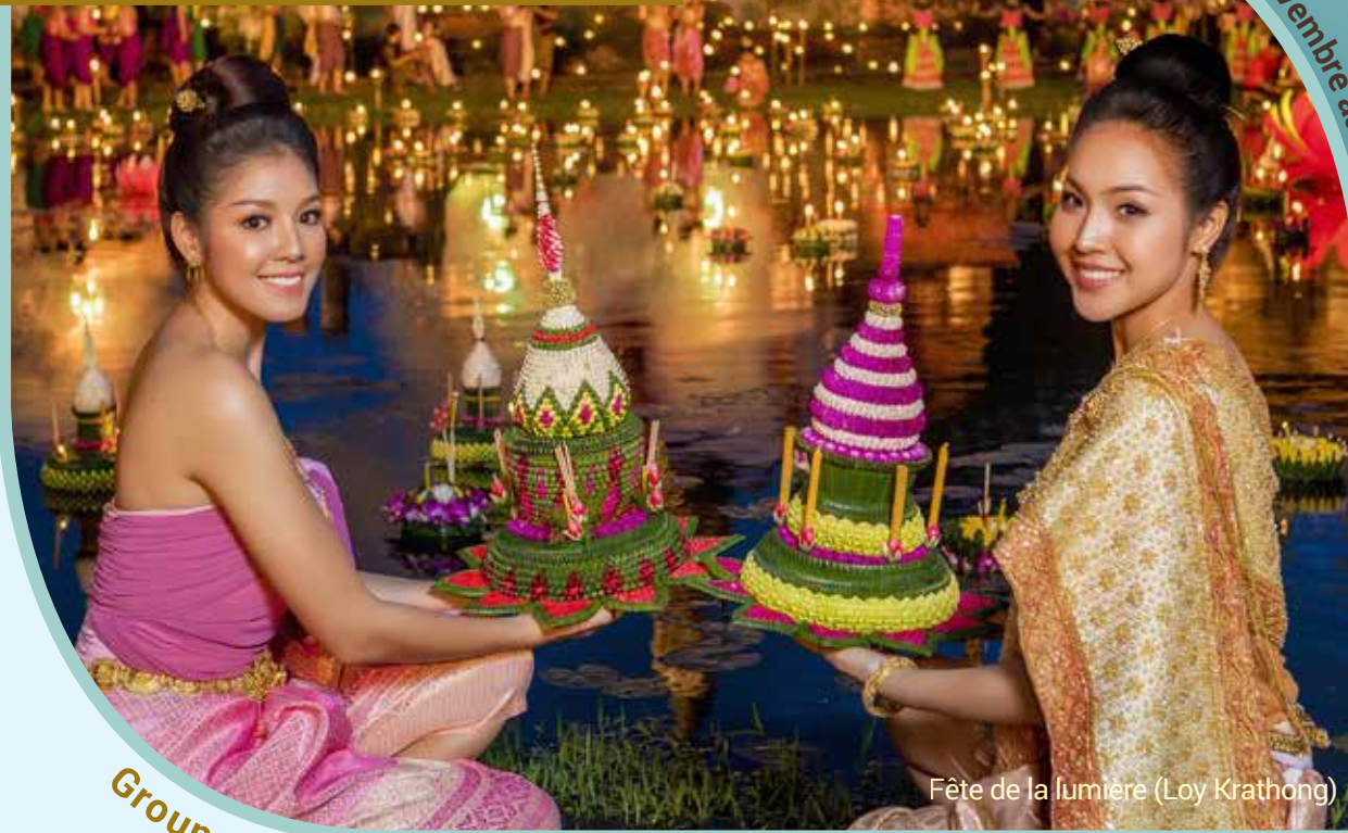
Fête de la lumière (Loy Krathong)