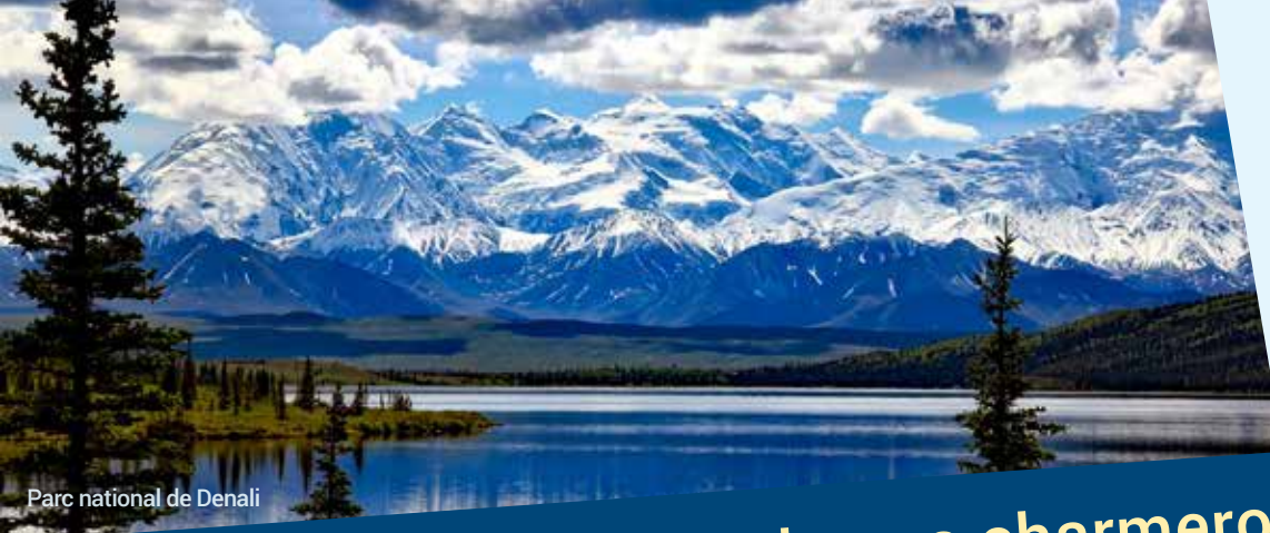
Parc national de Denali