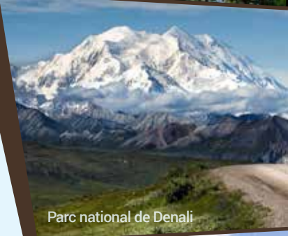
Parc national de Denali