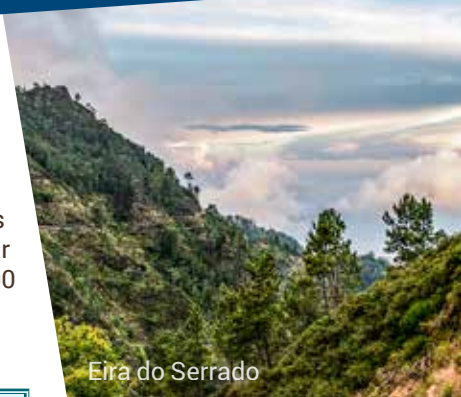
Eira do Serrado

Petit-déjeuner à l'hôtel. Transfert vers l'aéroport pour votre vol direct avec Air Canada sur Montréal. Arrivée à Montréal et retour vers le cœur du Québec. (PD)