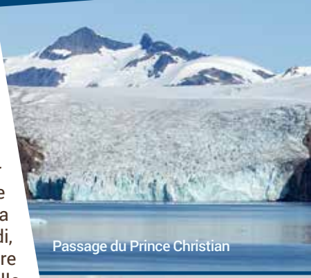
Passage du Prince Christian

fait de résoudre le problème en chauffant de l'eau claire et pure avec les eaux du forage et de donner naissance à un lac d'eau chaude d'un bleu paradisiaque aux vertus dermatologiques évidentes. Les eaux sont surchargées de sel et de silice. Le bleu laiteux et les tuyauteries brillantes de la station qui alimentent en eaux chaudes des milliers d'habitations, tranchent curieusement avec les vastes champs de lave noire et les chaînes volcaniques enneigées qui la ceignent. Retour vers Reykjavik et vous ferez un petit tour de ville en autobus et à pied avec votre guide local. Connue pour sa beauté naturelle et son charme détendu de petite ville, Reykjavik est également considérée comme la « capitale septentrionale de la vie nocturne », attirant les voyageurs par son atmosphère vivante et conviviale. En fin d'avant-midi, vous retournerez à bord de votre magnifique navire. Votre dîner se prendra à bord et profitez de votre après-midi pour vous familiariser avec votre navire ou bien pour faire une promenade personnelle avant le départ du navire à 17 h 00. (PD/D/S)