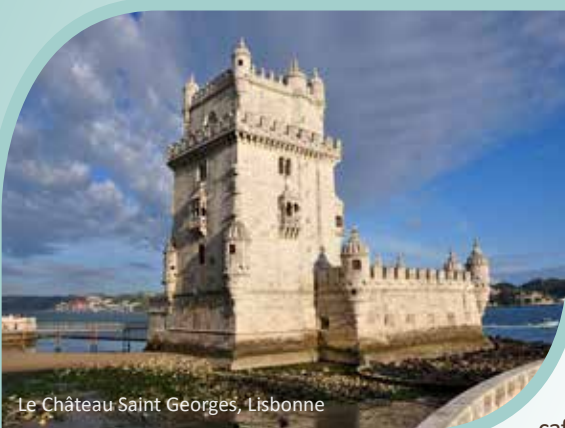
Le Château Saint Georges, Lisbonne

nombreux cloîtres et fenêtres combinant différents styles gothiques et manuélines. La rotonde, construite au XII e siècle et bâtie sur un plan polygonal à 16 côtés, typique de l'architecture des Templiers dénommée « charola », est également saisissante. Un arrêt pour le lunch suivra avant de repartir à la découverte de la ville de Coimbra , une ville chargée d'histoire, située sur les rives du fleuve Mondego. Coimbra abrite la plus ancienne université du Portugal, qui au fil des années, a marqué l'image de la ville maintenant devenue la cité des étudiants. Érigée sur un site dominant la ville et surplombant le fleuve Mondego, cette université bâtie au XII e siècle et inscrite sur la liste du patrimoine de l'UNESCO, est composée de plusieurs bâtiments. Lors de votre visite, vous pourrez admirer la richesse des édifices qui la composent. Votre passage dans la ville de Coimbra se conclura par une balade à pied dans les ruelles de son centre historique situé dans la partie basse de la ville, à l'extérieur des murailles médiévales. Vous serez charmés à coup sûr, par la beauté des maisons patinées par le temps, des bâtiments de différentes époques, l'ambiance des cafés, boutiques et restaurants qui s'y trouvent, sans oublier, la découverte de la cathédrale forteresse et de ses anciennes portes musulmanes, des portes fortifiées qui servaient d'entrée principale à la ville au