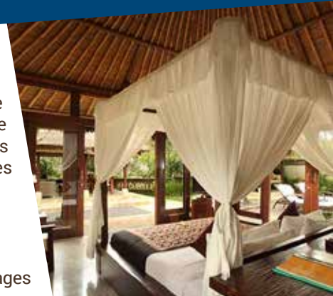
UBUD VILLAGE RESORT AND SPA 5

Petit-déjeuner à l'hôtel. Journée libre. Profitez-en pour essayer les installations de l'hôtel ou pour découvrir les environs à votre propre rythme. D'ailleurs, Ubud est le centre d'artisanat par excellence pour faire vos achats. Souper. (PD/S)