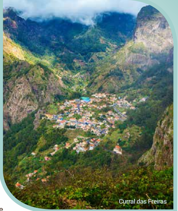
Curral das Freiras

Après le petit-déjeuner, transfert à l'aéroport de Lisbonne. À l'arrivée à Madère, accueil par votre accompagnateur. Dîner au restaurant et visite du jardin botanique à Funchal. Le souhait de doter Madère d'un jardin botanique remonte au XVII e siècle, et fut réalisé en 1960. Le jardin botanique, avec une superficie de plus de 35 000 m 2 , est doté de plus de 2 000 plantes exotiques, provenant de tous les continents, dont certaines espèces botaniques sont en voie de disparition. Ce fantastique jardin est composé de plusieurs arbres et arbustes décoratifs, d'une zone avec des orchidées, de pelouses, de belvédères et d'un amphithéâtre pour des activités ludiques. Installation à votre magnifique hôtel de bord de mer, le Pestana Carlton Madère 5* pour les 7 prochaines nuits. Souper en soirée. (PD/D/S)