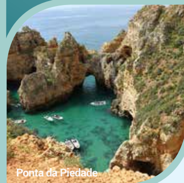
Ponta da Piedade