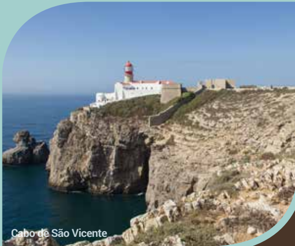
Cabo de São Vicente