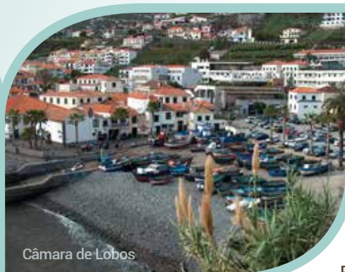
Câmara de Lobos

de Porto da Cruz. Ensuite, nous assisterons à un concert de mandoline suivi d'une dégustation de rhum et d'une dégustation de gastronomie traditionnelle à l'« Engenho » de Porto da Cruz. Après avoir profité de cette tradition, il sera temps de se rendre dans la région de Faial pour le dîner. Nous explorerons ensuite Santana, célèbre pour ses maisons aux toits de chaume. Dîner à Faial, puis départ pour le Pico do Arieiro, le deuxième plus haut sommet de Madère à 1 810 mètres, via le col de Poiso à 1 400 mètres. Retour à l'hôtel. Souper et nuitée. (PD/D/S)