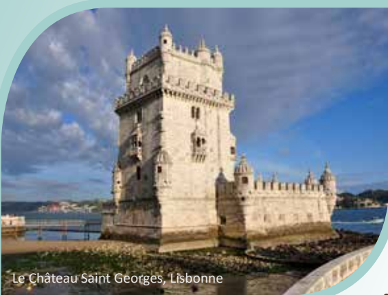
Le Château Saint Georges, Lisbonne

qui en a récupéré les biens et le personnel. C'est au XVI e siècle que la forteresse s'est transformée en un magnifique château de chevaliers regroupant un grand nombre de monuments architecturaux qui ont été conservés dans ce bourg médiéval et que vous aurez le bonheur de découvrir, lors de votre visite du couvent du Christ , classé au patrimoine de l'UNESCO en 1983. Vous serez transportés au temps des chevaliers du Temple et serez à coup sûr impressionnés par l'architecture des nombreux cloîtres et fenêtres combinant différents styles gothiques et manuelins. La rotonde, construite au XII e siècle et bâtie sur un plan polygonal à 16 côtés, typique de l'architecture des Templiers dénommée « charola », est également saisissante. Un arrêt pour le lunch suivra avant de repartir à la découverte de la ville de Coimbra , une ville chargée d'histoire, située sur les rives du fleuve Mondego. Coimbra abrite la plus ancienne université du Portugal, qui au fil des années, a marqué l'image de la ville maintenant devenue la cité des étudiants. Érigée sur un site dominant la ville et surplombant le fleuve Mondego, cette université bâtie au XII e siècle et inscrite sur la liste du patrimoine de l'UNESCO, est composée de plusieurs bâtiments. Lors de votre visite, vous pourrez admirer la richesse des édifices qui la composent. Votre passage dans la ville de Coimbra se conclura par