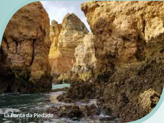
La Ponta da Piedade

*Veuillez prendre note que les kilométrages par jour sont donnés à titre indicatif seulement. Les itinéraires journaliers, pour le bien fondé du programme, pourraient être modifiés sans aucun autre avis.