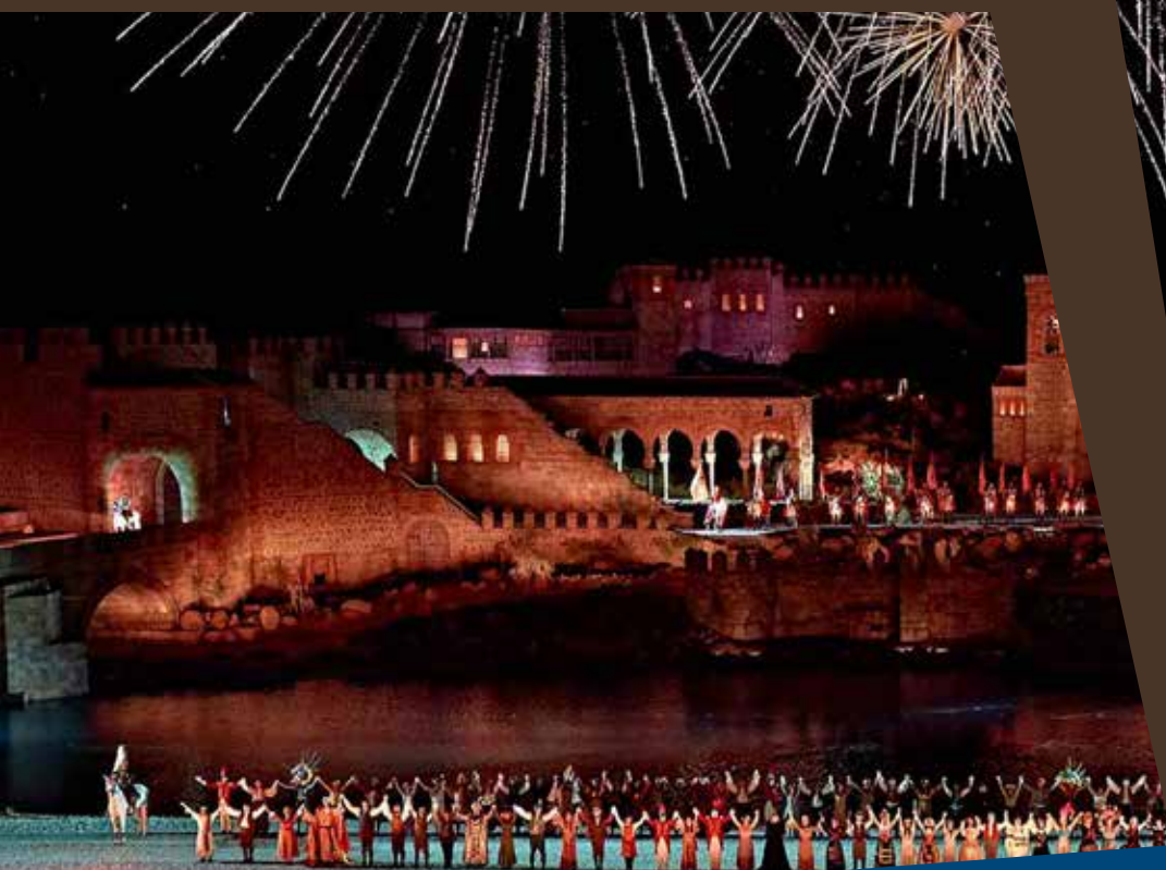
Puy du Fou

À BORD DU MS R.E. WAYDELICH L.J. 5 ANCRES DE CROISIÈRE EUROPE