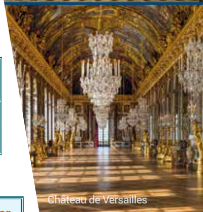
Château de Versailles