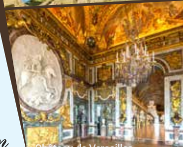
Château de Versailles