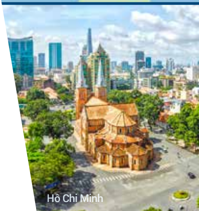
Hồ Chí Minh