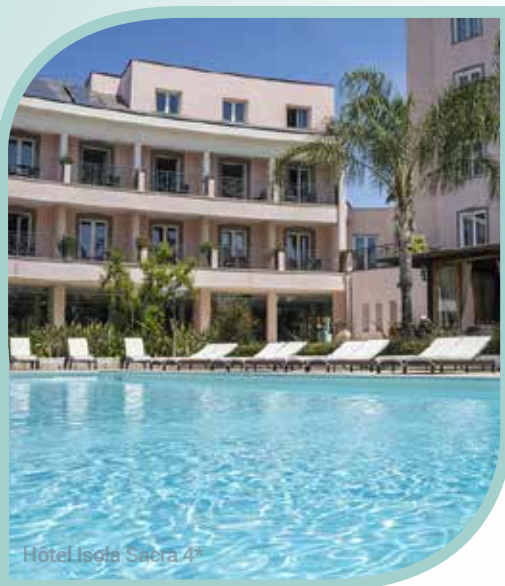
Hôtel Isola Sacra 4*