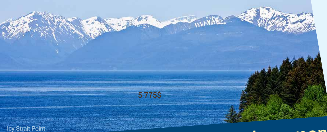
Icy Strait Point