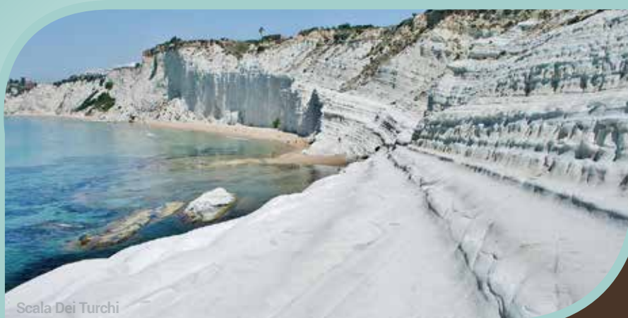
Scala Dei Turchi