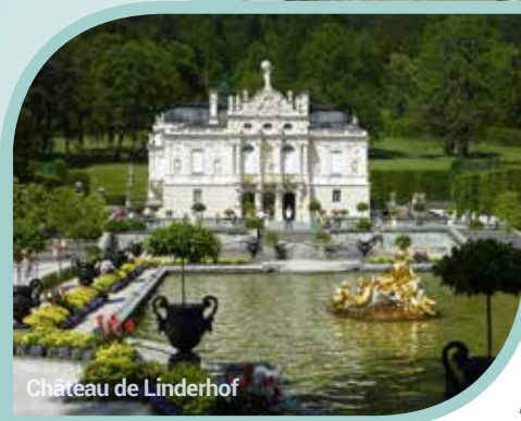
Château de Linderhof