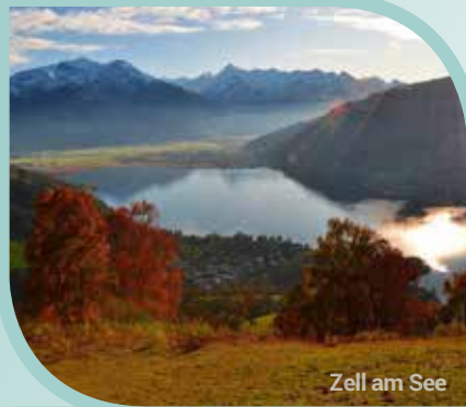
Zell am See