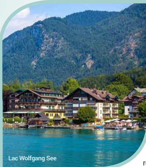
Lac Wolfgang See