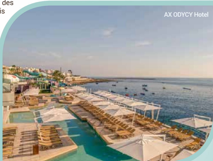
AX ODYCY Hotel