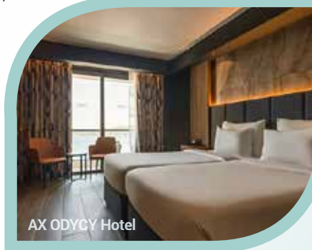
AX ODYCY Hotel