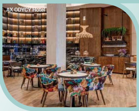
AX ODYCY Hotel