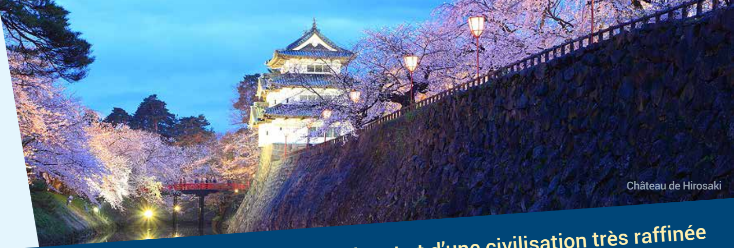
Château de Hirosaki