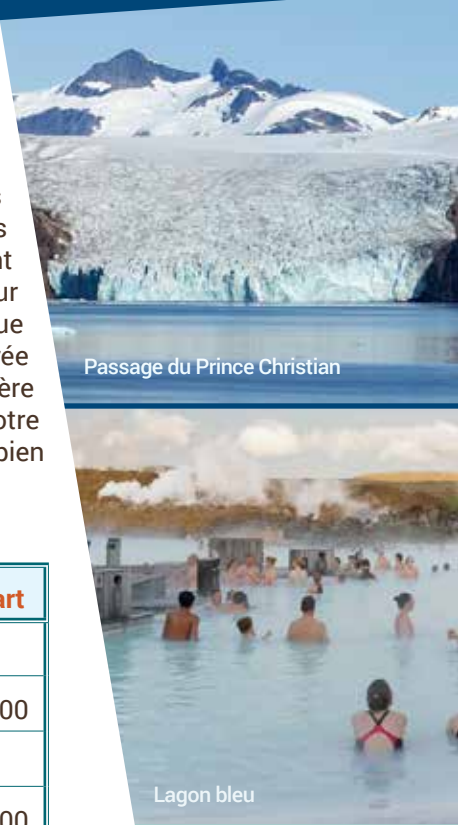
Passage du Prince Christian

que prévue. Les ingénieurs islandais et importants ont fait de résoudre le problème en chauffant de l'eau claire et pure avec les eaux du forage et de donner naissance à un lac d'eau chaude d'un bleu paradisiaque aux vertus dermatologiques évidentes. Les eaux sont surchargées de sel et de silice. Le bleu laiteux et les tuyauteries brillantes de la station qui alimentent en eaux chaudes des milliers d'habitations, tranchent curieusement avec les vastes champs de lave noire et les chaînes volcaniques enneigées qui la ceinturent. Retour vers Reykjavik et vous ferez un petit tour de ville en autobus et à pied avec votre guide local. Connue pour sa beauté naturelle et son charme détendu de petite ville, Reykjavik est également considérée comme la « capitale septentrionale de la vie nocturne », attirant les voyageurs par son atmosphère vivante et conviviale. En fin d'avant-midi, vous retournerez à bord de votre magnifique navire. Votre dîner se prendra à bord et profitez de votre après-midi pour vous familiariser avec votre navire ou bien pour faire une promenade personnelle avant le départ du navire à 17 h 00. (PD/D/S)