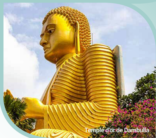
Temple d'or de Dambulla

Petit-déjeuner à l'hôtel. Transfert à Dambulla. En route, arrêt au temple d'Or de Dambulla, qui a été construit par le roi Walagambahu au 1 er siècle avant J.-C. Il est aujourd'hui l'un des sites du patrimoine mondial de l'UNESCO. C'est une merveille architecturale et artistique qui offre un aperçu fascinant de l'histoire et de la culture bouddhistes du Sri Lanka. Il est aussi appelé « temple de la grotte de Dambulla ». Ces grottes, devrions-nous dire, 5 au total, sont ornées de statues et de fresques qui racontent des histoires anciennes et sacrées. Vous passerez de salle en salle pour découvrir de magnifiques sculptures de Bouddhas, 153 en tout dont une de 14 m de long. Les peintures murales couvrent une surface de 2 100 m 2 et illustrent divers événements de la vie du Bouddha, ainsi que des histoires du Jataka (les vies antérieures du Bouddha). Ses murs et ses plafonds, couverts de peintures colorées, représentent la plus large aire de fresques au monde. Retour à l'hôtel pour profiter de ses installations. (PD/D/S)