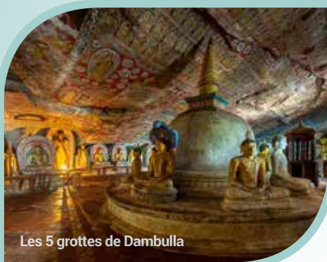
Les 5 grottes de Dambulla

Petit-déjeuner. Nous partons pour Ella, un petit village de la province d'Uva, terre immaculée située au sud des régions montagneuses de l'île. À une petite dizaine de kilomètres de là, arrêt à la chute de Ravana. Sa cascade mesure environ 25 mètres de hauteur et se déverse dans une piscine naturelle en contrebas. Elle est entourée de végétation luxuriante et de rochers, créant un cadre pittoresque et rafraîchissant. Dîner et installation à l'hôtel. Cet après-midi, les amateurs de safari et de la vie sauvage vont encore se régaler. Vous repartez pour Yala, l'un des parcs nationaux les plus célèbres du Sri Lanka. Cette réserve se consacre à